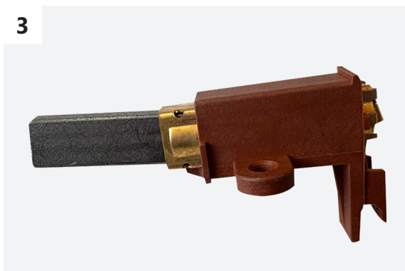
Die Kohlebürste im ausgefahrenen Zustand.

Man muss von hinterwärts einen dünnen Schraubendreher o.ä. in die Feder einführen und dann mit sachtem, aber kontrolliertem Druck etwas schieben. Die Kohlebürste wird dann vorne aus dem Kunststoffgehäuse herausfahren. Die Kohlebürste ist nun bereit für den Einbau.