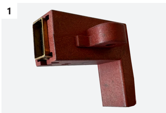
Die Kohlebürste befindet sich im Kunststoffgehäuse.